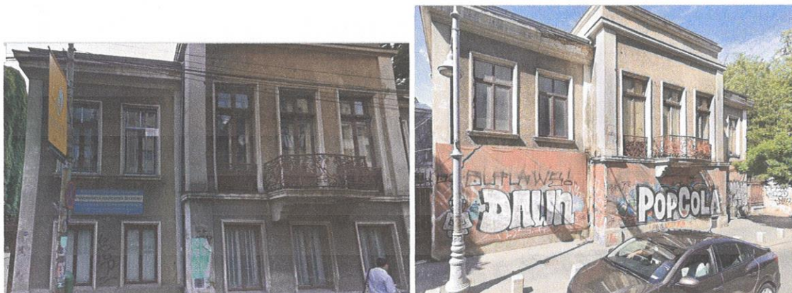
Figura 2 - Imobilul UPB din str. Victoriei nr. 149, 2008 vs 2023

În ceea ce privește eficiența investițiilor, nu toate clădirile UNSTPB au beneficiat de modernizare. De exemplu un imobil de aproximativ 4.000 mp într-o zonă foarte centrală a capitalei (Str. Victoriei Nr 149) este pur și simplu ignorat în ultimii 12 ani. Ar putea fi transformat ușor într-o superbă casă pentru oaspeți sau un centru pentru conferințe și întâlniri academice.