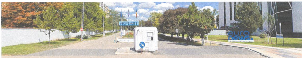
Figura 4 - Intrare campus UPB fără emblemele universitare

Mă opresc aici în a evidenția provocările existente. Un singur lucru aș vrea să menționez, este demoralizator pentru mine ca, de fiecare dată când vin în campusul universitar, să fiu întâmpinat de o nouă siglă Euronews, și nu de emblema universității. Acesta este unul dintre motivele pentru care candidez la funcția de rector al Universității Naționale de Știință și Tehnologie POLITEHNICA București.